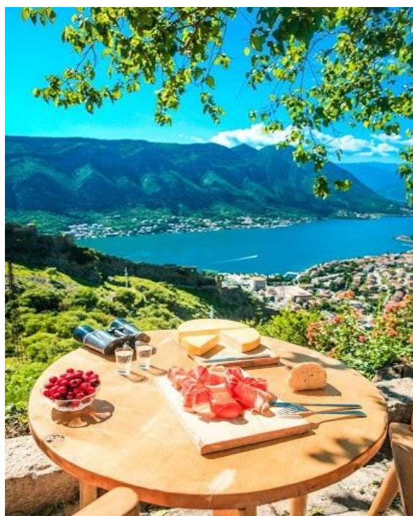
Pogled iz sela Špiljari

Turizam kao pokretač crnogorske ekonomije predstavlja značajno tržište za domaće proizvode. Tradicionalni proizvodi visokog kvaliteta (organski proizvodi) dopuniće turističku ponudu, a povezivanje poljoprivrede i turizma ogleda se i u razvoju seoskog turizma.