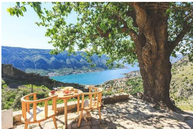
Pogled iz sela Špiljari

Bogatstvo prirodnog i kulturnog nasljeđa Crne Gore u njenim ruralnim područjima probudilo je interes turističke tražnje za nečim novim i autentičnim. Sve veći broj turista teži zdravom načinu života, uživanju u prirodi, očuvanim običajima i drugim autentičnim iskustvima.